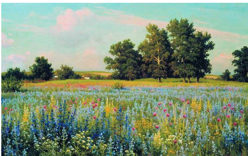
(Картина Б.Щербакова «Разноцветье Донское»)

29 июня 1900 года родился Антуан Мари Жан-Батист Роже де Сент-Экзюпери - французский писатель, поэт и профессиональный летчик.